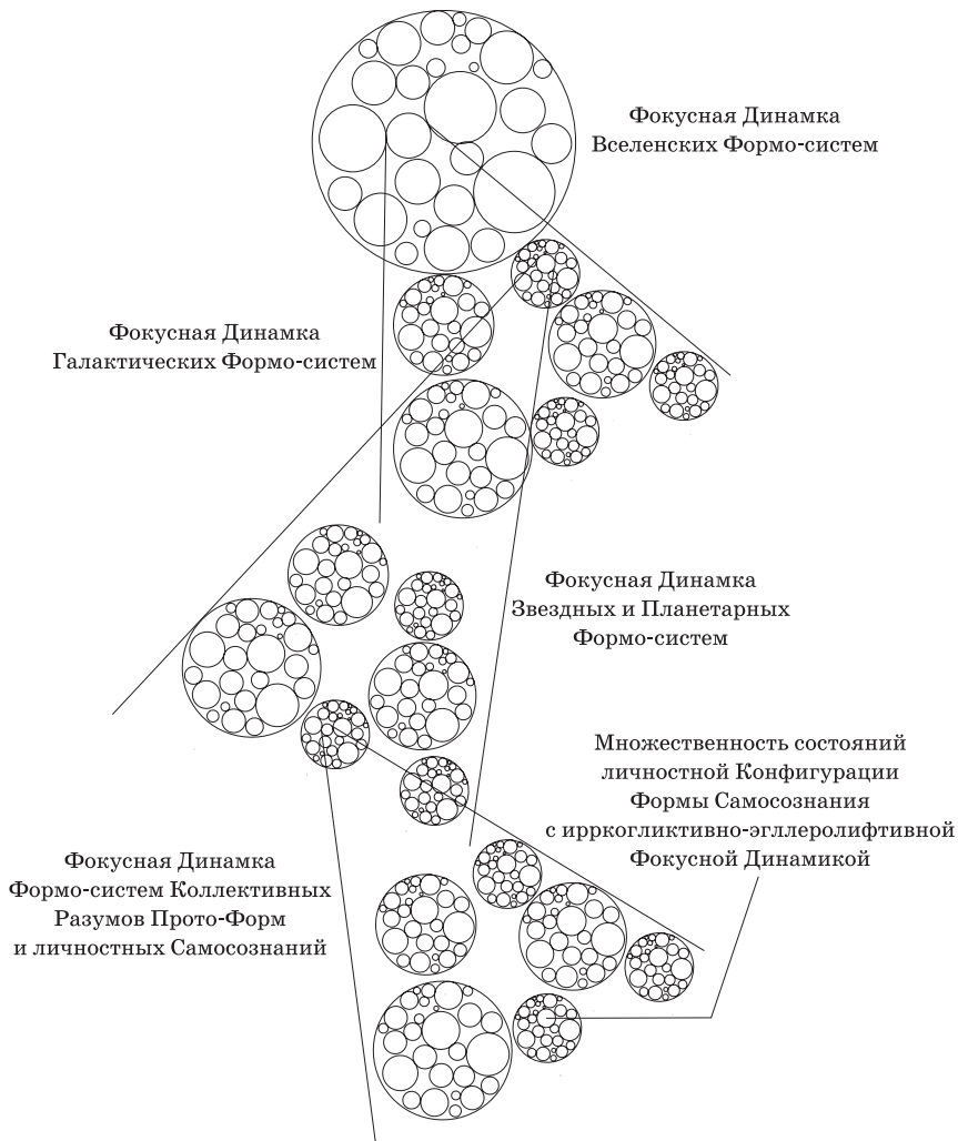
Рис. 3. Наглядная упрощённая демонстрация Акта симультанного проявления из Энерго-Плазмы всех энергоинформационных структур Мироздания.

2.1095. Подчёркиваю ещё раз: в каждом из резонансов свойственной ей мерности каждая из бесчисленного множества разно-Качественных типов Вселенных, структурирующих этот резонанс, фокусно образуется вместе — и параллельно! — с Фокусными Динамиками